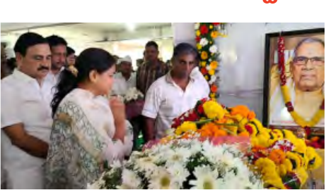
అనారోగ్య కారణాలతో గురువారం మృతి చెందారు.