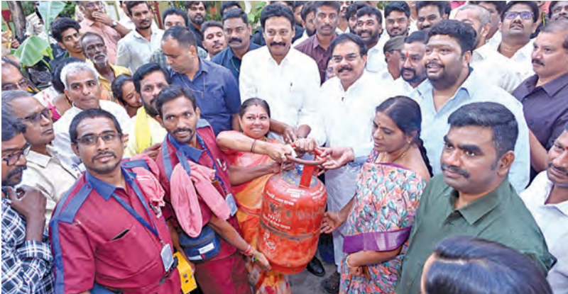
శక్తూరు విజయవాడలో లబ్ధిదారులకు గ్యాస్ సిలెండర్ల అందజేపును మంత్రి నాదెండ్ల మనోహర్ రాష్ట్రాధిపత్యం చేస్తున్నారని తెలుపుతున్న చిత్రం

3 వారాల్లో 50 లక్షల సిలిండర్లు పంపిణీ మంత్రి నాదెండ్ల మనోహర్ తెలుసుకుంటున్నట్లు రాష్ట్ర పౌర సరఫరాలు, విజయవాడ, నవంబరు 22 ప్రభాతవార్త ప్రతినిధి: అహారం, వినయోగదారుల వ్యవహారాల దీపం 2. పథకంపై లబ్ధిదారుల మనోగతాన్ని శాఖమంత్రి నాదెండ్ల మనోహర్ తెలిపారు. >>2