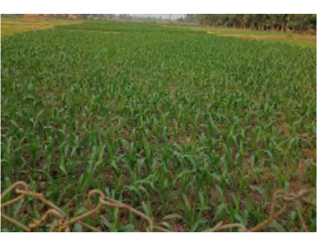
రైతులు సిద్ధమవుతున్నారని దుక్కి దున్న కుండా విత్తనాలు పెట్టి విధానం చేసుకోవాలని ఆయన చెప్పారు. ఈ కార్యక్రమంలో వ్యవసాయ శాఖ ఎంపీఓ.కే.వో.ల రైతులు పాల్గొన్నారు.